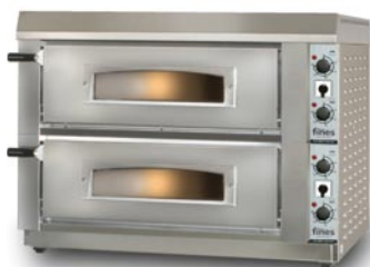
ES 660-2 manual