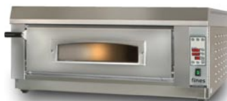
ES 660-1 digital