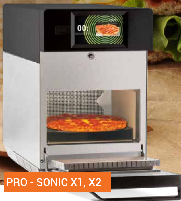
PRO - SONIC X1, X2

Moč in hitrost za pripravo raznovrstnih jedi.